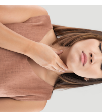
MAL DI GOLLA