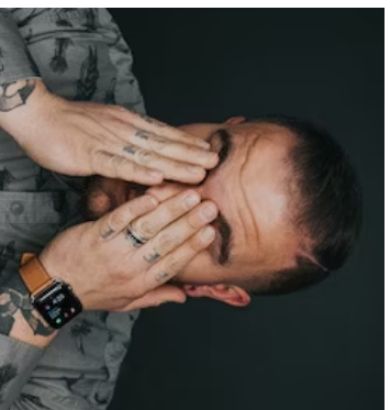
MAL DI OCCHI